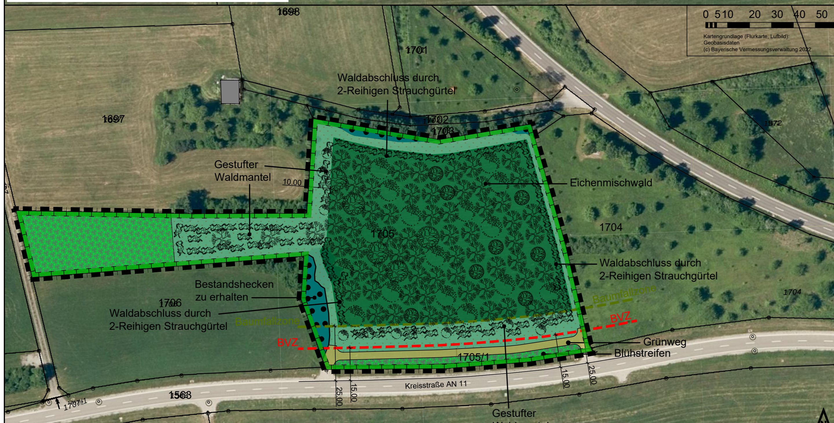
Aufwertungsmaßnahmen auf externer Ausgleichsfläche