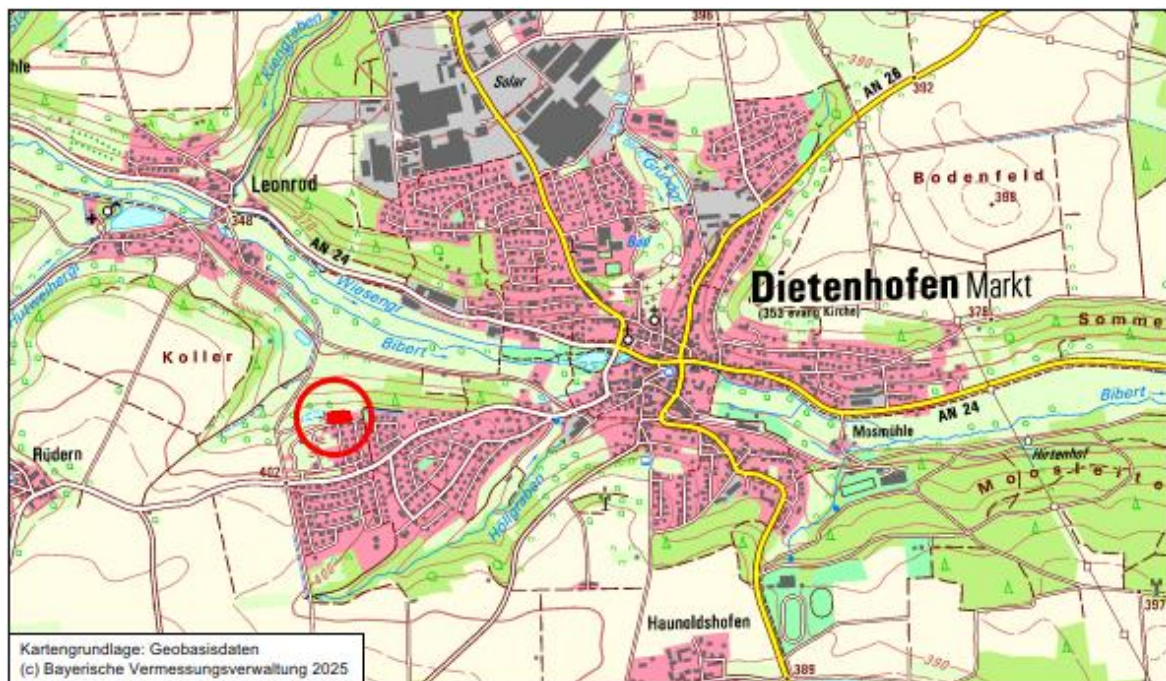
Übersichtslageplan zur Lage des Geltungsbereichs der 1. Änderung des Bebauungsplans Nr. 39 „Nördlich der Rüderner Straße“, rot flächig markiert = Änderungsbereich; ohne Maßstab

Die Aufstellung der 1. Änderung des Bebauungsplans Nr. 39 „Nördlich der Rüderner Straße“ erfolgt im vereinfachten Verfahren gem. § 13 BauGB. Es wird darauf hingewiesen, dass gem. §13 Abs. 3 BauGB die Aufstellung des Bebauungsplans ohne Durchführung einer Umweltprüfung gem. § 2 Abs. 4 BauGB durchgeführt wird. Ursächlich für den Verzicht auf die Umweltprüfung ist, dass mit der Änderung keine zusätzlichen überbaubaren Flächen entstehen, sondern vorrangig die zulässigen Wohneinheiten beschränkt werden. Erhebliche negative Umweltauswirkungen sind hieraus nicht zu erwarten. Gemäß § 13 Abs. 3 BauGB wird weiterhin vom