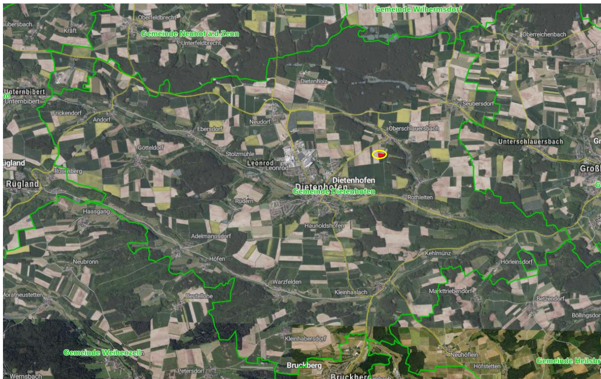
Abb. Auszug aus dem BayernAtlas (unmaßstäblich) (Plangebiet rot, gelb)

Der Geltungsbereich des Bebauungsplans umfasst das Grundstück mit der Flurstücknummer 543 der Gemarkung Seubersdorf. Der Änderungsbereich liegt in Umgebung von landwirtschaftlich genutzter Fläche südlich von Oberschlauersbach.